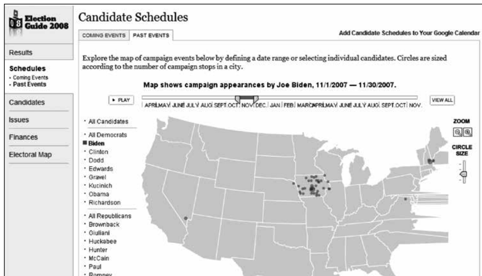
Figura 2: Modelo de periodismo de datos con mapas, desarrollado por The New York Times en Google Maps sobre las elecciones presidenciales en Estados Unidos.

visión de los retos que asumen un gobierno y las implicaciones de sus decisiones); el crowdsourcing (formato de trabajo colectivo) ahora más viables con el poder de los ordenadores para trabajar en red (computadores para hacer conexiones). También están los mashups , que permiten combinar distintas fuentes de información y proporcionan al usuario la opción de usar a su antojo el producto informativo.