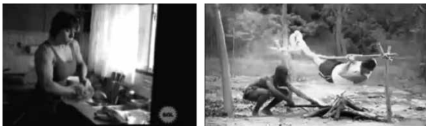
Figuras 29 y 30: fotogramas de spots Magistral y El Comercio.

Spots como el de detergente Magistral (figura 29), que muestra a una madre de familia con unos brazos musculosos por lavar platos (su entrenador le insiste en que lave y friegue platos para mantenerlos, es decir, perennizar su lugar en la cocina); o el aviso tailandés que ofrece un atún bajo en grasa (Youtube, 2009e), donde la protagonista contiene la respiración para ostentar un abdomen plano frente a sus compañeros de trabajo (varones), pueden llevarnos a pensar en los códigos que estamos enviando en la formación de la feminidad y su aceptación dentro de la sociedad.