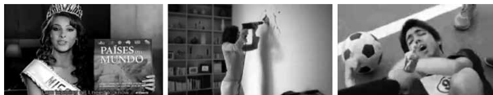
Figuras 14, 15 y 16: fotogramas de spots El Comercio, Seguros Mercator y Cristal.

c) La mujer tonta: el spot “Miss Universo” del diario El Comercio (figura 14) exhibe a una reina de belleza con el típico tono de “chica boba”. Sin embargo, este canon no se ha quedado sólo en las rubias ni en las estadounidenses; sino que ha pasado como una categoría “común” al resto de las mujeres. De modo tal que su éxito, especialmente en el campo laboral, muchas veces es cuestionado y asociado con algún tipo de favor de índole sexual. En muchos contextos, los comentarios femeninos suelen ser subvalorados y aún continua una lucha por el reconocimiento e igualdad de espacios, así como cuotas de participación significativos en grupos de poder como en los partidos políticos.