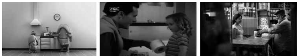
Figuras 38, 39 y 40: fotogramas de spots Lucchetti, Elite y Fast.

En Argentina la marca de pastas Lucchetti lanzó la campaña “Mamá Lucchetti” (figura 38). En la animación aparece una madre interactuando con uno de sus hijos de manera tal que rompe con la efigie idealizada de “ser buena madre”, como en aquellos spots donde siempre aparece feliz, bella y arreglada. Sedal (Youtube, 2008l) lanza el siguiente mensaje: “Sentirte orgullosa despeina y eso te queda muy bien”, mostrando una historia donde una madre soltera no tiene temor de decirlo. Elite (figura 39) propone a un padre de familia amoroso, que acompaña a su hija al baño como quizá muchos padres jóvenes estén haciendo hoy en día.