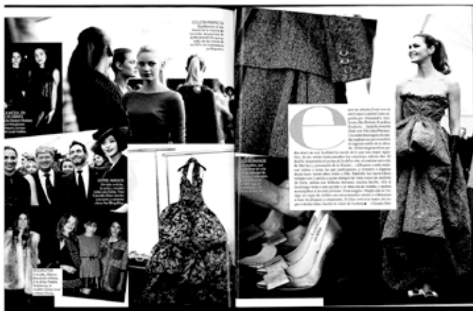
Figura 2: Artículo en revista especializada de moda.